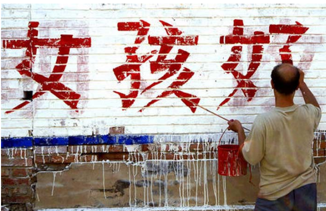
"Meisjes zijn goed" - tegen discriminatie en abortus

Een vrouw geboren op 20 januari 1980 (werd dus op 16 februari van dat jaar al twee jaar oud en is dus in 2007 - volgens de Chinese traditionele kalender - 29 jaar) . Zij is zwanger geworden rond 20 juli van dit jaar (6 e maanmaand van 2007) en zal dus bevallen van een meisje.